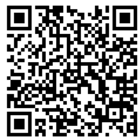
アンケート WEB回答フォーム QRコード